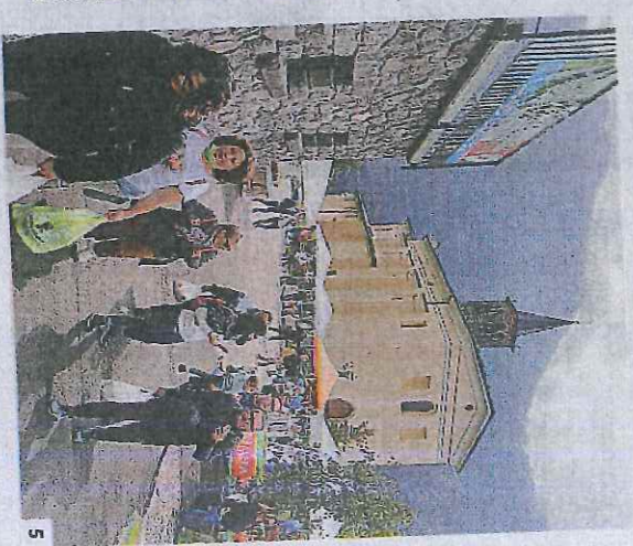
1. I soci della cooperativa di comunità «Terre Oltre la Goggia» di Moio de' Calvi. 2. Grazie al loro intervento sono riusciti a riaprire l'unico negozio di alimentari del paese. 3. Il logo della cooperativa, fondata un anno fa. 4. Non mancano le difficoltà: comprare macchinari e arredi richiede partecipazione a bandi e contatti costanti con realtà del territorio. 5. La sagra della mela di inizio ottobre a Moio de' Calvi